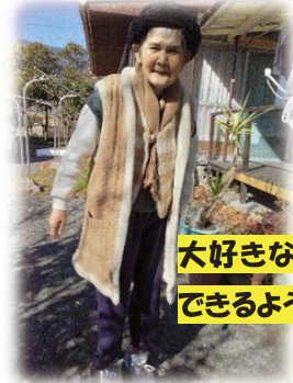
大好きな散歩もドライブもできるようになりました！