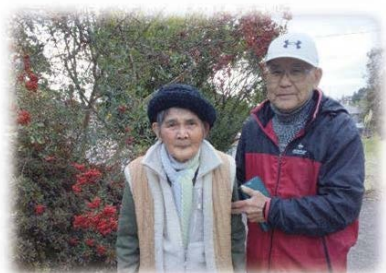
仲良しご夫婦です♡

食事が摂れず、歩行時のふらつきもあるため寝たきりに近い生活を送っていた A 様。 A 様は「自宅で生活したい」と希望されていましたが、体調の変化により、ご家族の精神的・身体的な負担も大きくなっていました。そこで私たち訪問看護ステーションが介入を開始し、医師や看護師、療法士、関係機関が連携して体調管理や生活動作の支援を行いました。介入後は、少しずつ体力が回復し、自分でトイレに行ったり、食器洗いをしたりとできることが増えました。ご家族からは「介護負担が減った」との声も聞かれます。現在は散歩や外出が可能となり、A 様もご家族も安心して在宅生活を続けています。