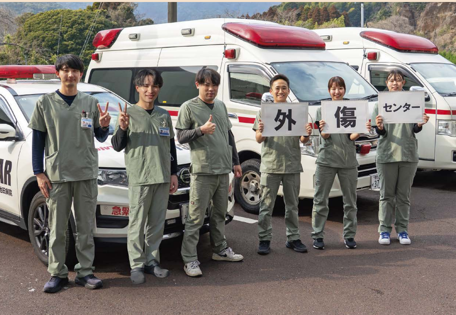
【表紙写真】外傷センタースタッフ