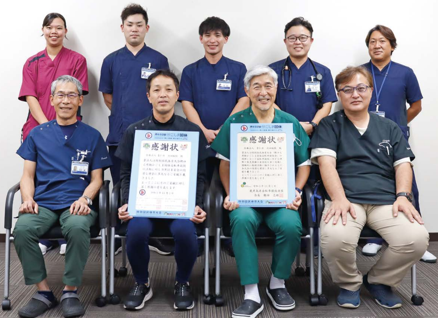
【表紙写真】医師・看護師・救急救命士で構成された鹿児島国体自転車競技医療救護チーム