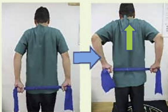
③タオル等を持って背中の上に上げる