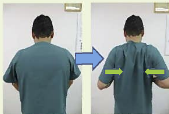
④肩甲骨で挟むように腕を後ろに引く