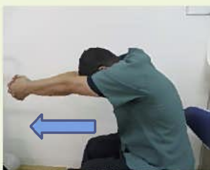
①手を組んで前後に伸ばす

今回は肩甲骨周囲の筋肉を柔らかくするストレッチをご紹介します。家でテレビを見ている時、お風呂上りに気軽に出来ますので、無理しない程度に是非！お試しください。