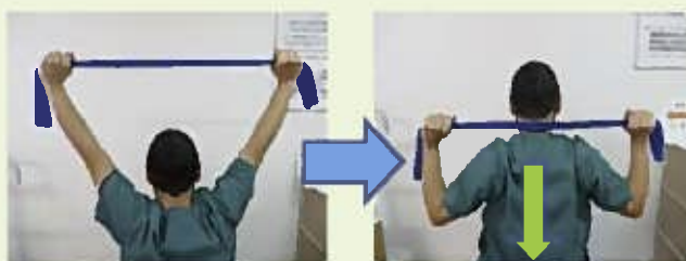
②タオル等を持って頭の後ろに下ろす