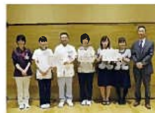
〔発表を終えて表彰の後〕

多忙な日常業務をこなしながら業務改善に取り組みましたが、QC推進員を始めQC指導員の協力により、今年度の発表大会も無事に終える事が出来ました。今回得られた教訓を生かして、次回以降もより良い発表大会になるように努めるとともに、全職員参加によって更にQC活動が充実するよう期待します。