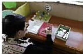
頭の体操コーナー