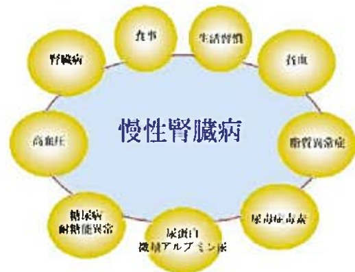
図1. CKD進行には多くの要因があり、原因を改善しなければ良くならない。

検尿異常で受診される方も多く、中高年の方であれば概ね生活習慣による腎臓のダメージ(腎硬化症)が考えられます。年齢相応の変化でもあり経過を見ることでよいと考えます。しかし尿検査と問診を聞くことで腎臓内科医はいろいろ考えています(図2)。肺炎は咳や痰が出ますが、腎炎は検尿異常でしかわかりません。むくみや貧血があるときは手遅れであることが多いです。そのため早期発見が非常に大事です。検査の中では正直たいへんな「腎生検」が絶対必要です(図3)。なぜなら、臆測で治療することはないからです。この検査によって、診断と程度が分かります。しかし腎臓病の全てに行なうわけではありませので誤解がないように。