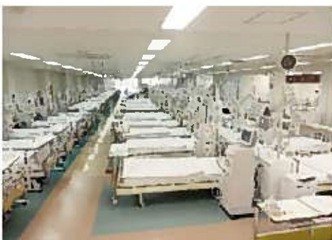
▲平成26年血液浄化センターリニューアル(104床)