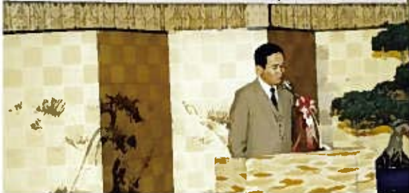
▲昭和53年 透析治療棟落成祝賀会