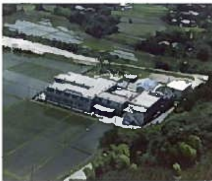
▲45年前 田んぼに囲まれた池田病院・長寿園の風景