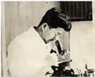
▲当時は自主と診療所がつながっており、5室の病室がありました。