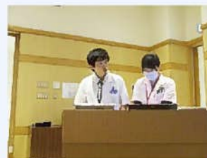
アポティケ (薬剤科)