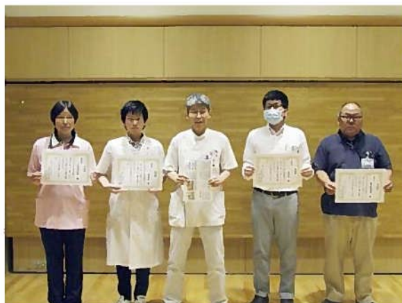
久木田医師と発表者