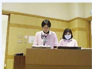
ドラエモン (3階東病棟)