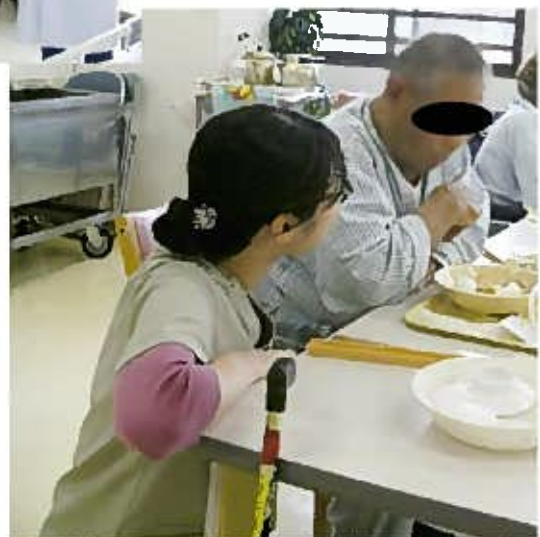
患者さま 食事風景