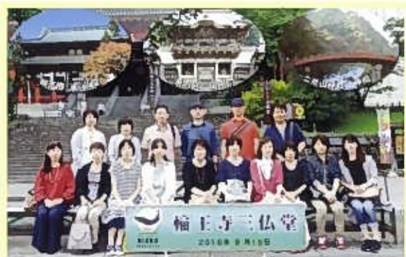
世界文化遺産参拝記念 平成28年9月15日 日光(鬼怒川温泉)