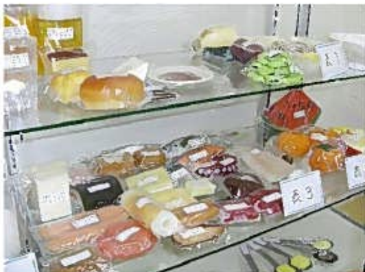
栄養指導のフードモデル