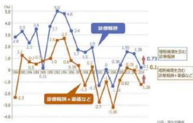
診療報酬改定率の推移

これらを背景に、池山病院は各病棟機能を向上させ、老健、特養、在宅サービス等のグループ内連携の充実を図ります。そして、それ以上に地域の病院・診療所との連携体制を強化し、協力関係の下で地域の方々の期待と信頼に応えてまいりたいと考えております。