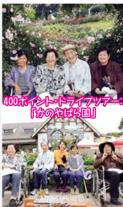
400ポイント・ドライブツアー： 「かのやばり園」