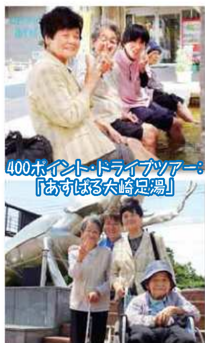
400ポイント・ドライブツアー： 「あすぼる大崎足湯」

一人ひとり目標があり、皆さんそれを楽しみにポイントを貯めていらっしゃいます。今回、ポイント還元にてドライブツアーやバラ園見学を行いました。「最高だった。」「行ってよかった。」や「今度はまた別の場所へ行きたい」と喜びの声が聞かれました。