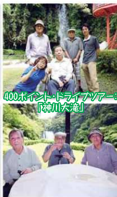
400ポイント・ドライブツアー： 「神川大滝」