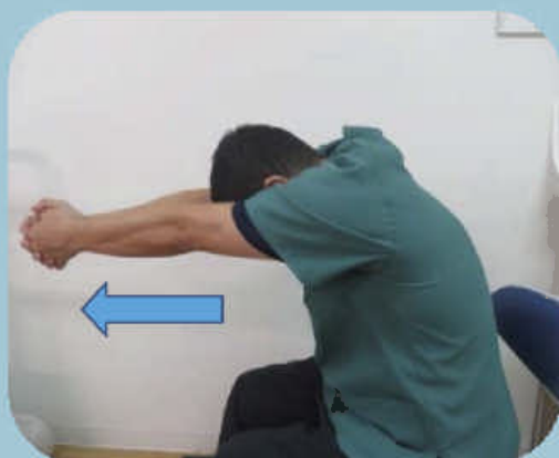
①手を組んで前方に伸ばす

今回は肩甲骨周囲の筋肉を柔らかくするストレッチをご紹介します。家でテレビを見ている時、お風呂上りに気軽に出来ますので、無理しない程度に是非！お試しください。