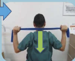
②タオル等を持って頭の後ろに下ろす