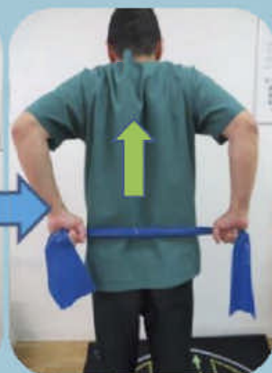
③タオル等を持って背中の上上げる