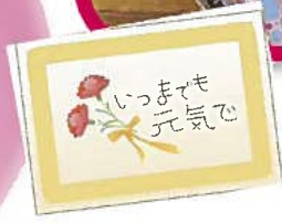
ひだまり入所 介護福祉士 西園聡子